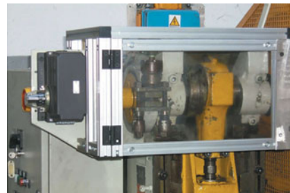
Použitie „kopiráka“ na excentrickom lise

Monitor rýchlosti sa používa vtedy, keď je potrebná kontrola otáčania hriadeľa. Najvzdialenejší spínací bod od hnacej strany spínacej jednotky je osadený sledovačom impulzov (indukčným snímačom).