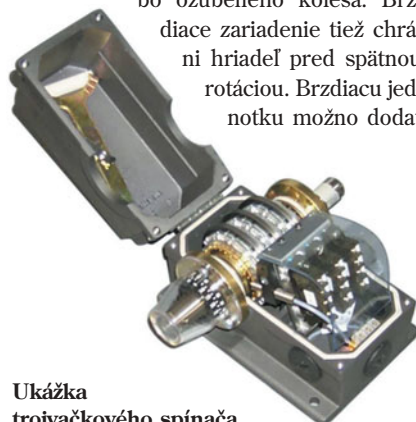
Ukážka trojvačkového spínača

Balluff ponúka rôzne prídavné jednotky k vačkovým spínačom BSW: monitorovanie rýchlosti, brzdná jednotka, prevodovky, spojky a ich kombinácie. Prevodovka s prevodovými pomermi od 8000 : 1 do 1 : 10 sa môže priamo pripojiť k vačkovému spínaču pomocou príruby. Brzdacie zariadenie je permanentne v prevádzke, čo spôsobuje trvalé brzdenie hnacieho hriadeľa. Tým sa dosiahne okamžité zastavenie pri zlomení nejakej časti hriadeľa, spojky alebo ozubeného kolesa. Brzdacie zariadenie tiež chráni hriadeľ pred spätnou rotáciou. Brzdiacu jednotku možno dodať