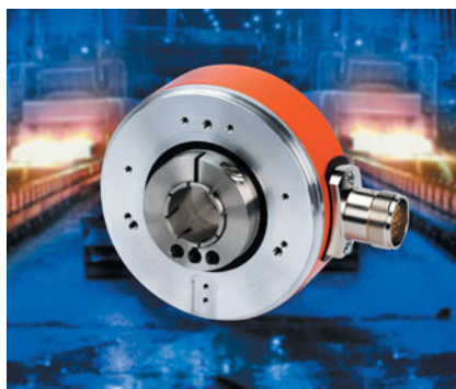
Nový robustný inkrementálny rotačný snímač s dutým hriadeľom A02H

Nový robustný snímač Kübler A02H rieši všetky spomenuté problémy. Jeho celková hĺbka je 3 x menšia ako hĺbka tradičných robustných zariadení a je oveľa robustnejšia ako štandardné rotačné snímače s dutým